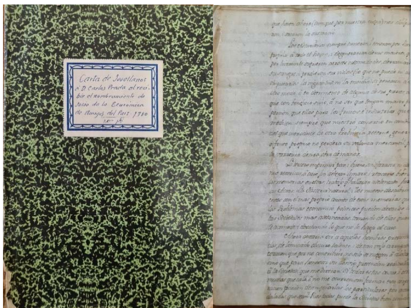
Figs. 1 y 2: Portada y última hoja conservada de la carta erróneamente atribuida a Jovellanos (ARIDEA, Fondo Ricardo Casielles. Caja 7.40(01)).

Sin embargo, la donación en 2012 de una parte del archivo de Ricardo Casielles al Real Instituto de Estudios Asturianos, hecha a iniciativa de sus nietas (RIDEA, 2012: 16), incluía esta carta, que no ha dejado de formar parte de los materiales reunidos con motivo de la exposición conmemorativa de los 75 años del Real Instituto de Estudios Asturianos, en cuyo catálogo aparece referenciada, siguiendo la atribución a Jovellanos (Rodríguez Álvarez, 2022: 108).